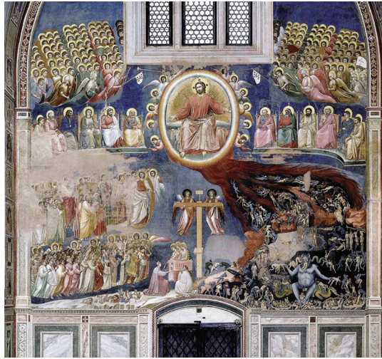
최후의 심판(Giotto di Bondone, 1266 ~ 1337)

오늘은 교회 전례력으로 새해 첫날인 대림 제1주일입니다. 곧 예수님께서 당당하게 재림하시는 그날을 기다리는 시기요, 동시에 아기 예수님이 오심을 마음 모아 기다리는 시기입니다. 이처럼 대림시기가